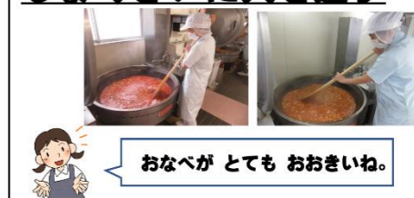
【給食技師の方々の努力や苦勞が伝わるスライド】

普段、食事の前に何気なく使っている「いただきます。」という言葉には、食材の生産者や調理している方々など食事に携わってくれた全ての人に感謝するという意味が込められていると言われます。一方で、わたしたち人間は、肉や魚、野菜、果物といった命あるものを食べながら生命を維持していることから、「多くの生き物の命を大切に頂きます。」という意味もあるそうです。自分の周りの「人・もの・こと」への感謝の気持ちを大切にしていきたいものです。